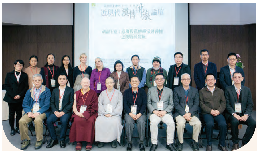
▲論壇與會學者的多元視野，更增研討的精彩與豐厚。