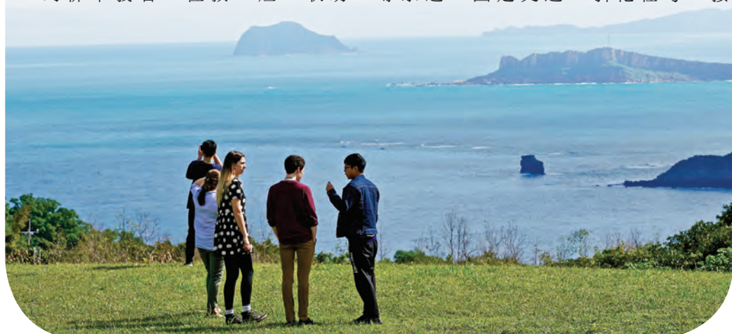
▲研習班還包括宗教體驗、寺院參訪等，青年學者走入現代佛教的場域親身感受、交流分享。