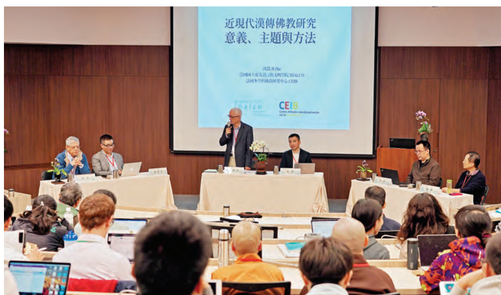
▲與會者在第四屆近現代漢傳佛教論壇，提出多元的關注主題與研究視角。

生命的意義，是在珍惜中，做自利利他的善行。我們與家人、與社會大眾的因緣是無法切割的，透過願力，可使我們與他人的關係更緊密結合，互相影響，互相分享。勸請大家都能許好願、行好願，共同轉動整體社會的大好運！祝福大家，阿彌陀佛！