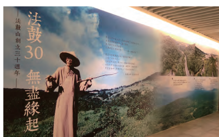
▶「法鼓30 無盡緣起」特展