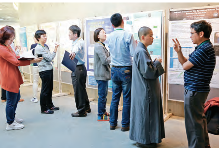
▲DADH 為臺灣數位人文學界中，最重要的年度研究成果發表的國際會議之一，國際上許多資訊與人文領域研究者皆前來與會，熱烈交流。