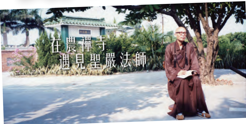
▲「在農禪寺遇見聖嚴法師」特展