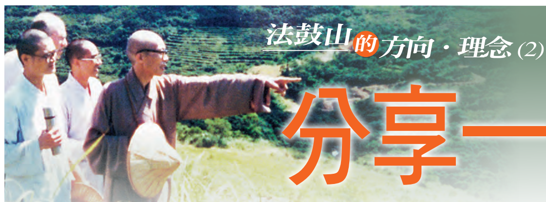
法鼓山的方向·理念(2)

人在生命過程中，可能只要有一、兩句非常受用的話，就會改變一生， 所以當我們知道一、兩句對自己有幫助的佛法時，將它轉告別人，這就是法鼓山的鼓手。