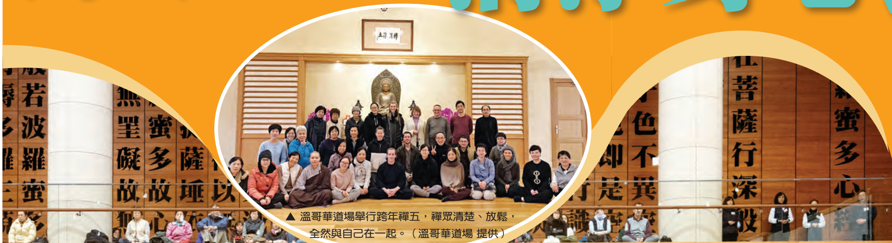
▲溫哥華道場舉行跨年禪五，禪眾清楚、放鬆，全然與自己在一起。

▼紫雲寺首辦跨年念佛禪三，總護常乘法師分享如何運用禪修的方法念佛。